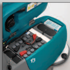
Batteripaket som räcker länge